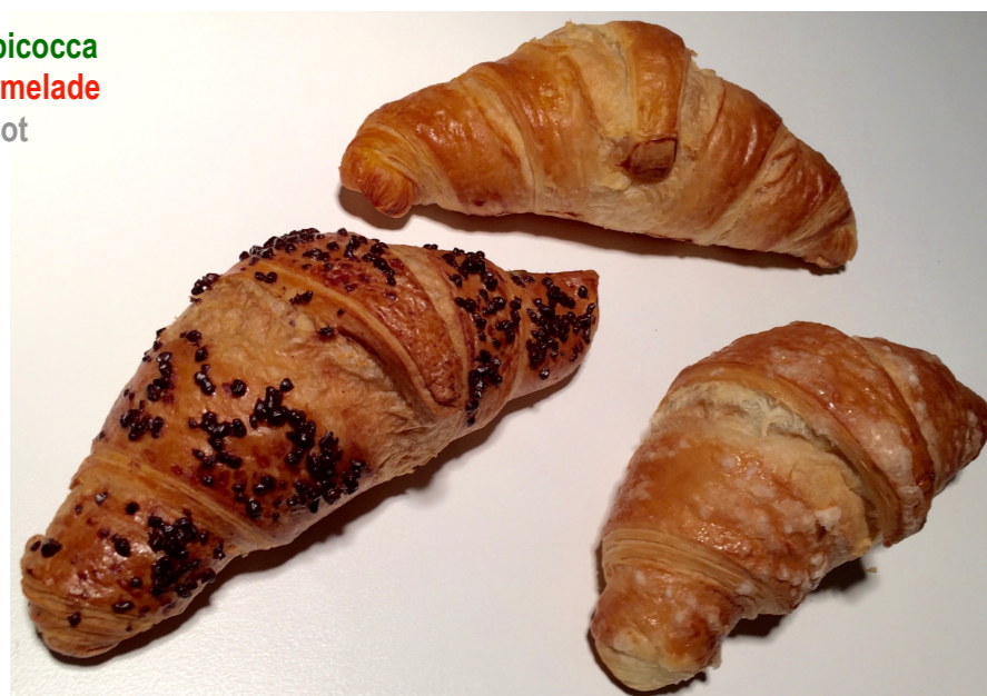
marmellata albicocca aprikosen marmelade jam apricot